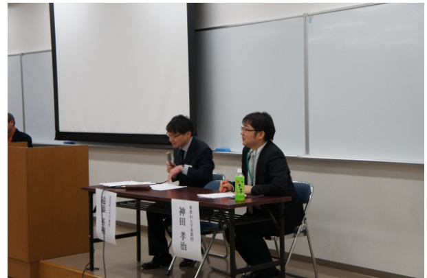
パネルディスカッション(2)の様子

終了後は、関西大学内のレストラン・チルコロにて、観光学術学会設立記念懇親会が開かれ、和気藹々とした雰囲気の中、参加者それぞれが観光学の未来について議論を交わし、盛んに交流がなされました。